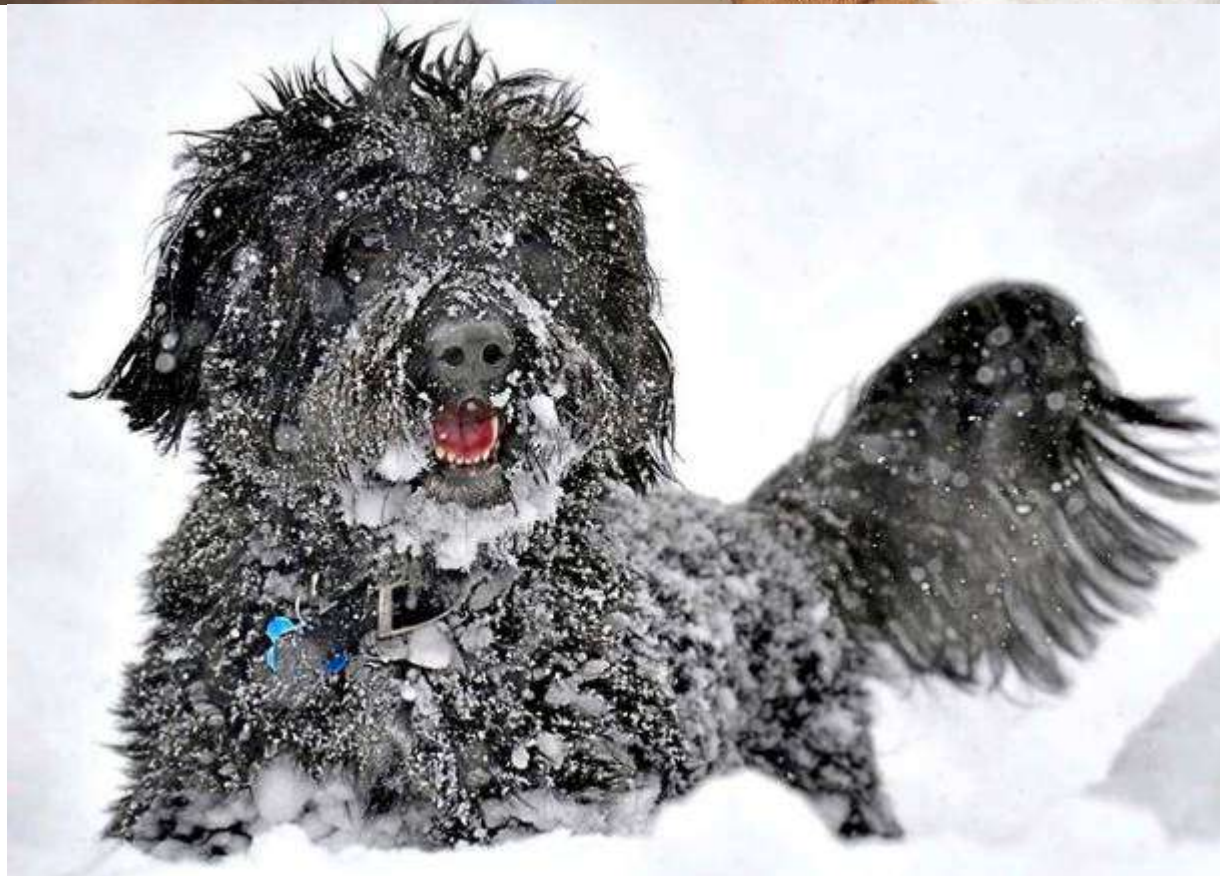
Tak dneska to bylo o psech různých....